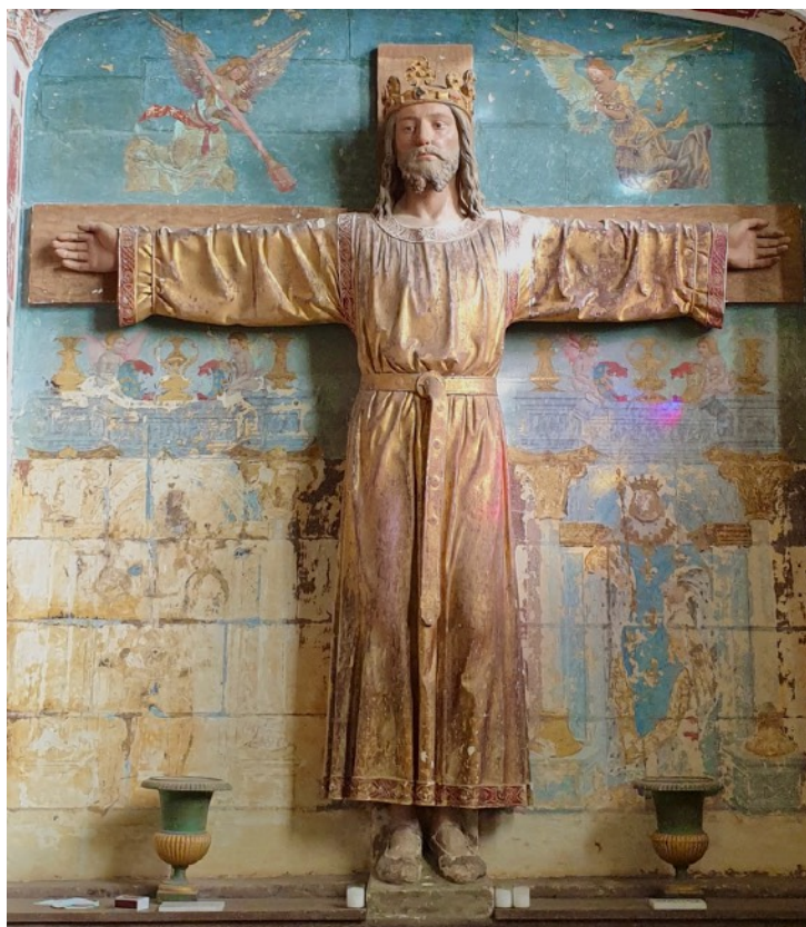
Christ Roi Chapelle du château de la Bourgonnière (Maine et Loire)

« Jérusalem, Jérusalem... combien de fois ai-je voulu rassembler tes enfants comme la poule rassemble ses poussins sous ses ailes, et vous n'avez pas voulu ! » Lc 13,34